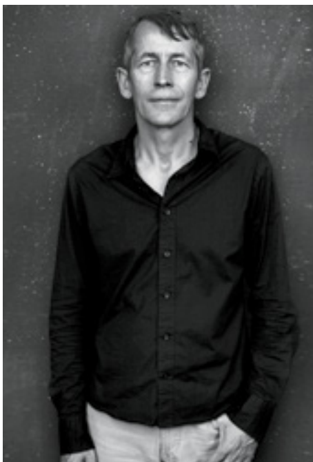
TEGENBEWEGING 'We moeten er vrede mee hebben in een nichemarkt te opereren.'

'Op kantoor kan ik niet gedijen. Dat is toch het onafhankelijkheidsstreven van de boer in mij.'