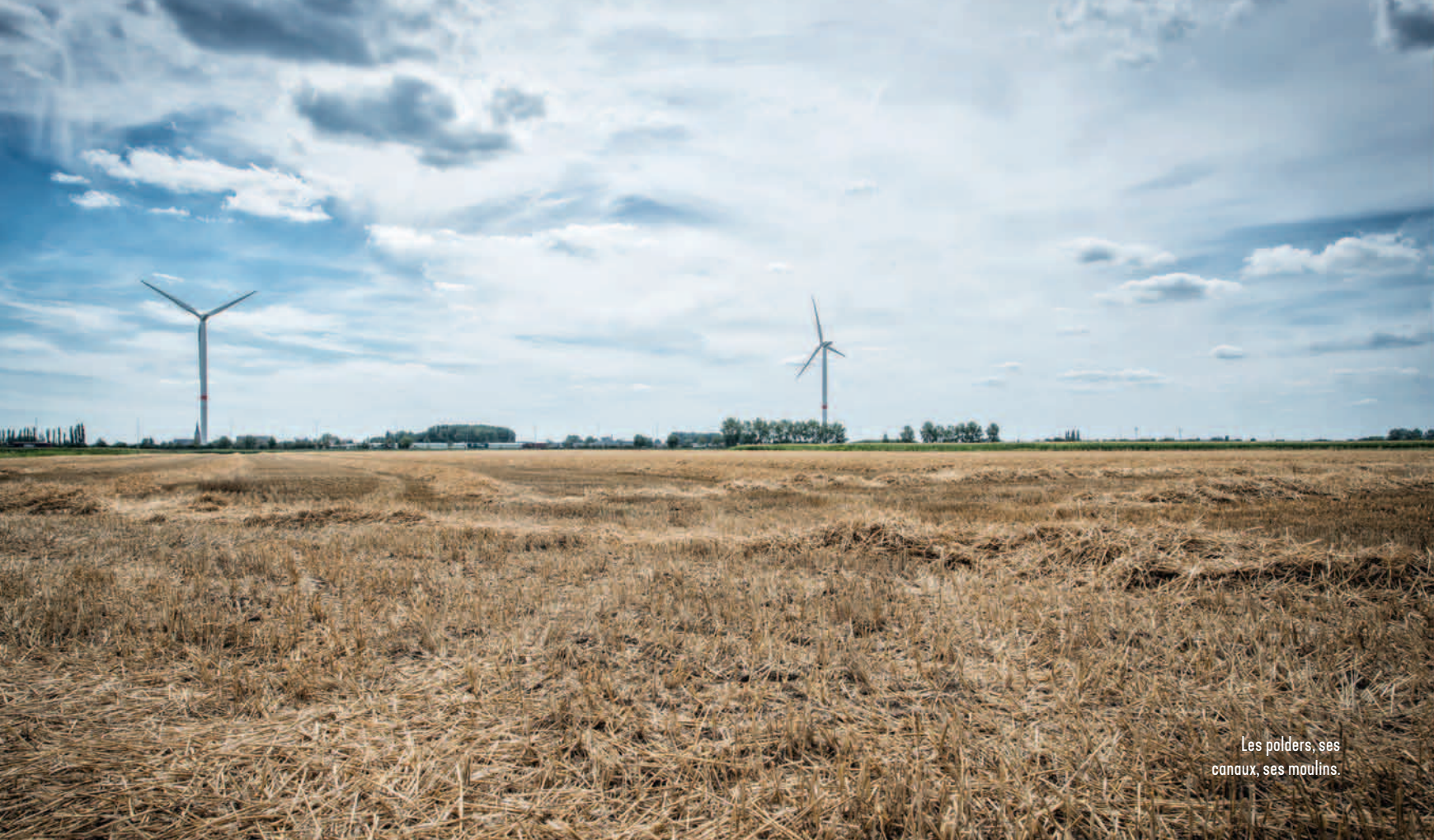
Les polders, ses canaux, ses moulins.