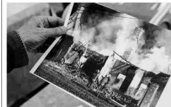
Een foto van de afgebrande hoeve van Maroy. Zijn lichaam werd er tussen het puin gevonden.

Een winkelmeeuwker merkte dat op en vertelde tegen haar vrienden over de slonzige man die schijnbaar toch veel geld had. Twee lokale boefjes, leden van de 'Bende van Evernys', vatten het plan op om hem te beroven. Ze maken hem 13.000 euro afhandig en rossen hem langdurig af. De volgende dag gaan twee anderen ook bij Da-